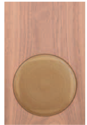
NetWorks Stereo-Set mit zusätzlichem CD-Spieler und Subwoofer – eine komplette Stereoanlage, die keine Wünsche offen lässt...